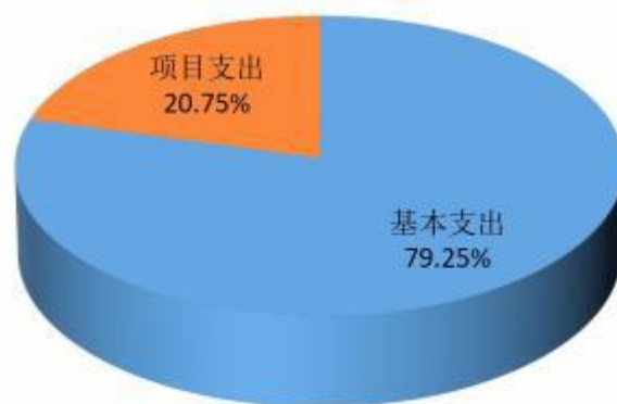
图3：支出决算构成情况