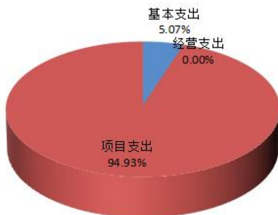
图3：支出决算构成情况

本部门2022年度支出合计10168.85万元，其中：基本支出515.48万元，占5.07%；项目支出9653.36万元，占94.93%；经营支出0万元，占0%；对附属单位补助支出0万元，占0%。